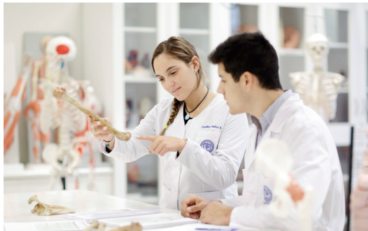
Jóvenes impulsaron la campaña #yotambiénmeuno , dirigida especialmente a internos de la USS que puedan estar al servicio de los pacientes.