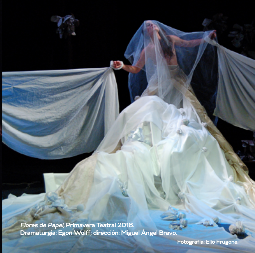
Flores de Papel , Primavera Teatral 2016.